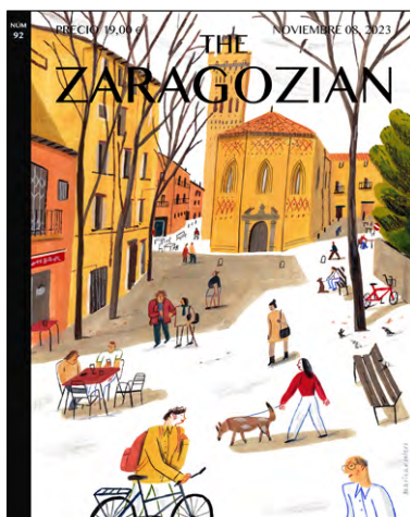
Portada #92. Marina Montero